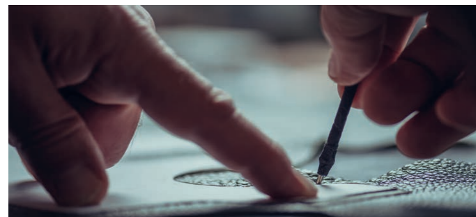
Von Meisterhand gefertigt.